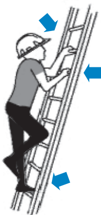
Contacto de tres puntos